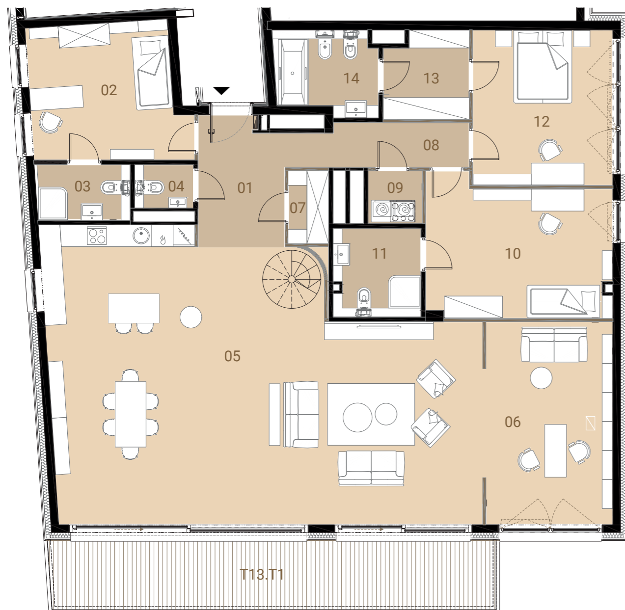
MIESZKANIE NA PLANIE BUDYNKU